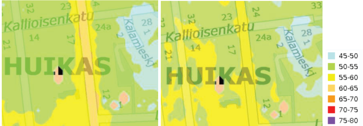
Kuva 2. Päivä- (vas.) ja yöajan (oik.) keskiäänitasot nykytilanteessa 2017.

Nykytilanteena on tarkasteltu Tampereen kaupungin vuoden 2017 nykytilannetta (Kuva 2). Keskiäänitasot alueella ovat alle 55 dB sekä päivällä että yöllä.