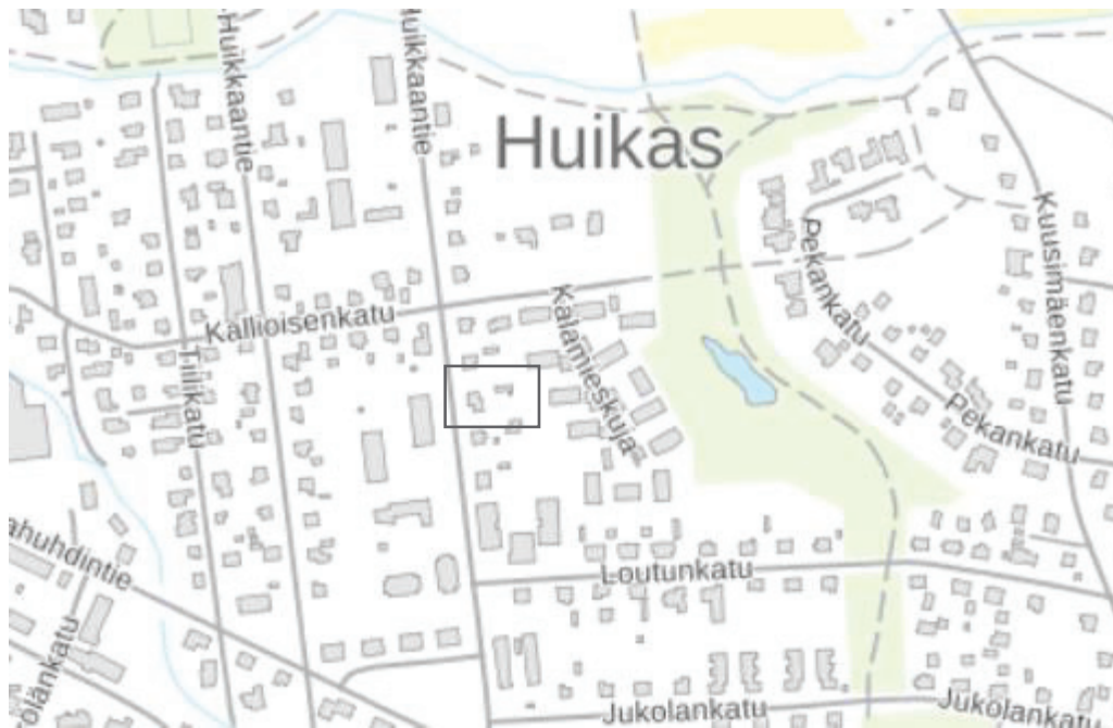
Kuva 1. Kaavan suunnittelualueen viitteellinen sijainti on merkitty suorakulmiolla. Paikkatietoikkuna, 2021.

Kaavan suunnittelualueen likimääräinen sijainti on esitetty kuvassa 1.